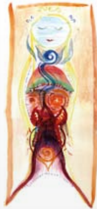
Mit vielen Illustrationen von Annabella Brenken